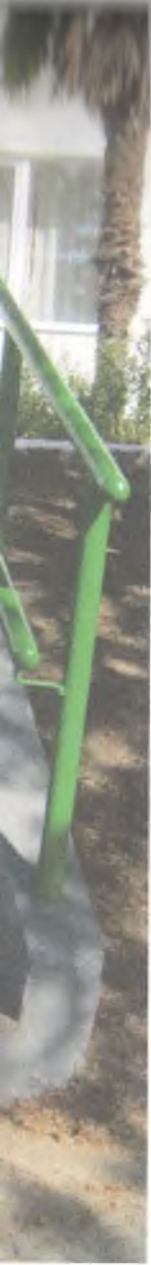
Фото №12 План – 1 территория МДОУ №19